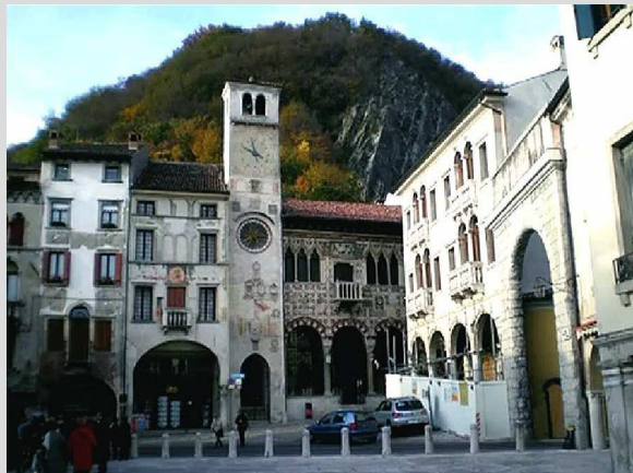
arrivo a Vittorio Veneto e visita al centro storico di Serravalle