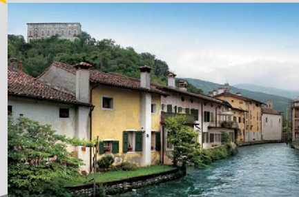
pausa pranzo in centro a Polcenigo