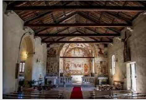
pausa caffè mattina in centro a Montereale Valcellina

da Vivaro a Vittorio Veneto percorso di circa km 66